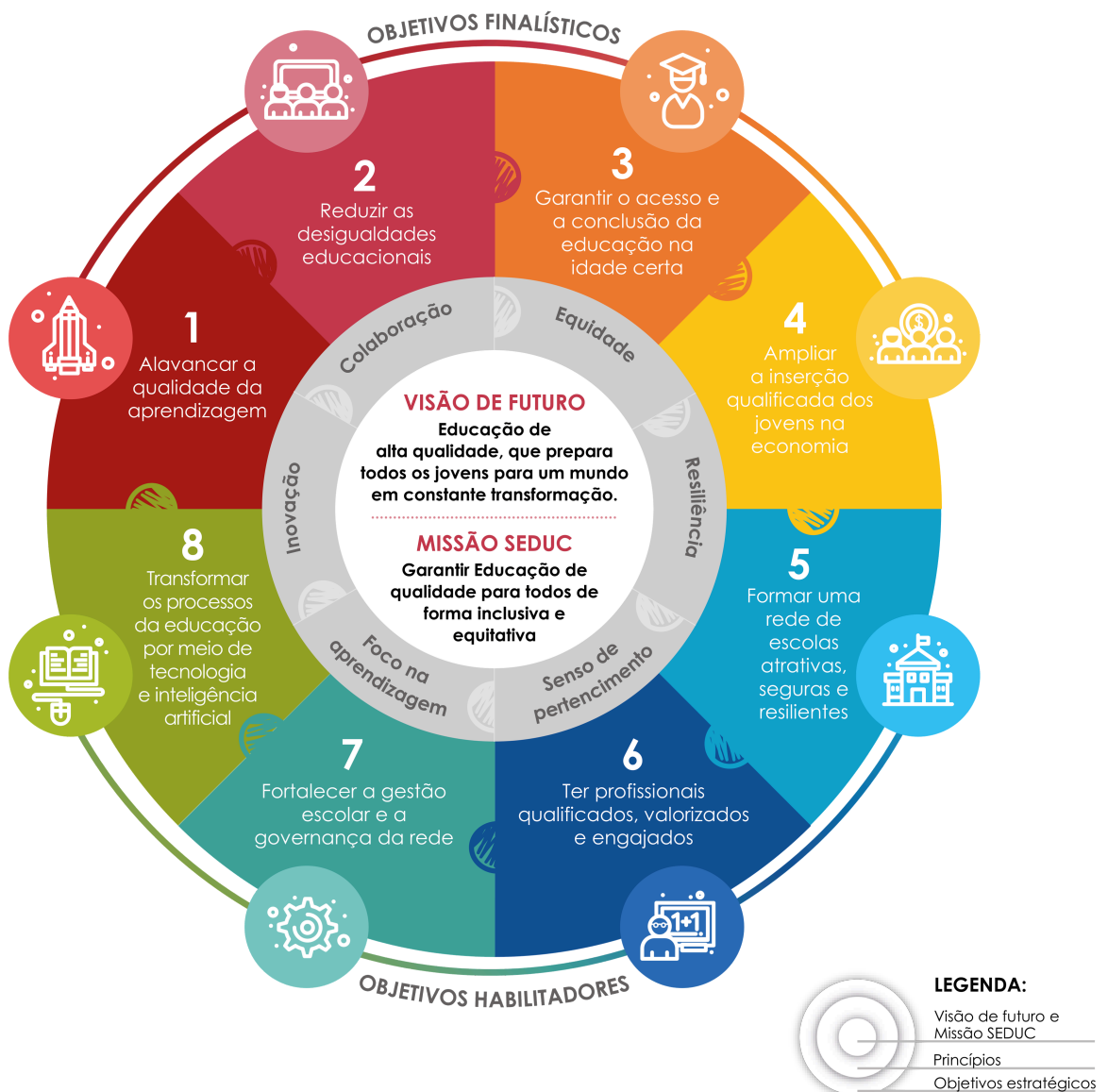
Figura 1 - Mandala da Agenda da Educação 2025-2035

Sendo assim, os objetivos da Agenda da Educação 2025-2035 são direcionados para uma educação de qualidade, inclusiva e equitativa, alinhada aos desafios e demandas da sociedade. Os objetivos são divididos em finalísticos e habilitadores e cada um possui metas associadas. Os objetivos habilitadores visam criar condições de gestão e organização, incorporando novas tecnologias e inteligência artificial. Já os objetivos finalísticos descrevem, de forma qualitativa, os principais resultados relacionados à visão de futuro da Secretaria de Educação do Rio Grande do Sul.