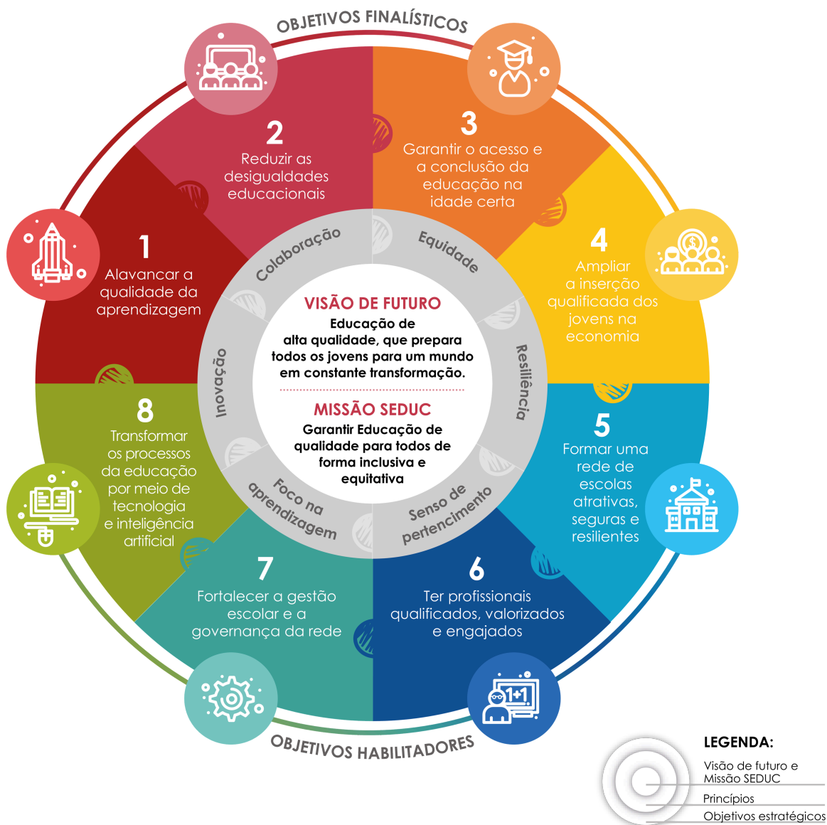
Figura 1 - Mandala da Agenda da Educação 2025-2035

Sendo assim, os objetivos da Agenda da Educação 2025-2035 são direcionados para uma educação de qualidade, inclusiva e equitativa, alinhada aos desafios e demandas da sociedade. Os objetivos são divididos em finalísticos e habilitadores e cada um possui metas associadas. Os objetivos habilitadores visam criar condições de gestão e organização, incorporando novas tecnologias e inteligência artificial. Já os objetivos finalísticos descrevem, de forma qualitativa, os principais resultados relacionados à visão de futuro da Secretaria de Educação do Rio Grande do Sul.