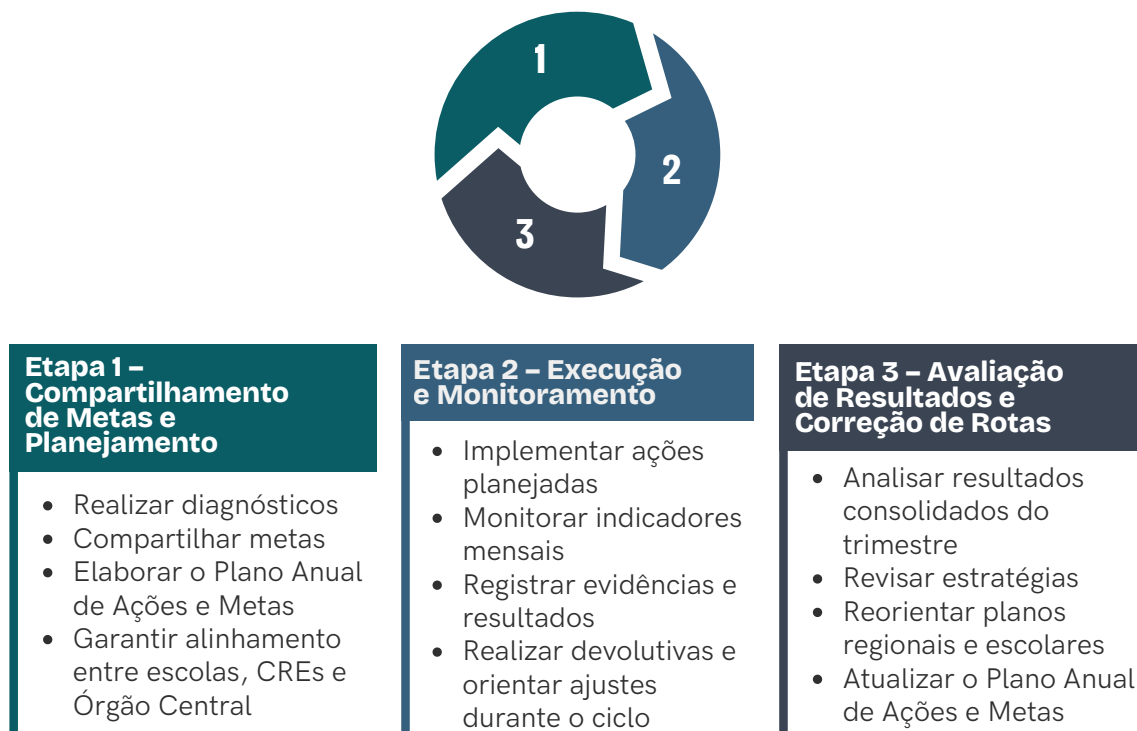
Figura 3 - O PDCA no Ciclo de Governança da Educação

Compartilhamento de Experiências: Processo de troca de práticas, aprendizados e soluções entre escolas, CREs e Órgão Central ao longo de todo o ciclo.